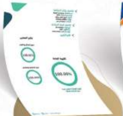
تقرير حوكمة الجمعية