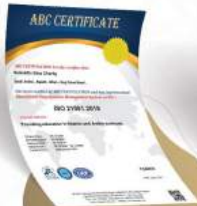
نظام إدارة المؤسسات التعليمية ISO 21001