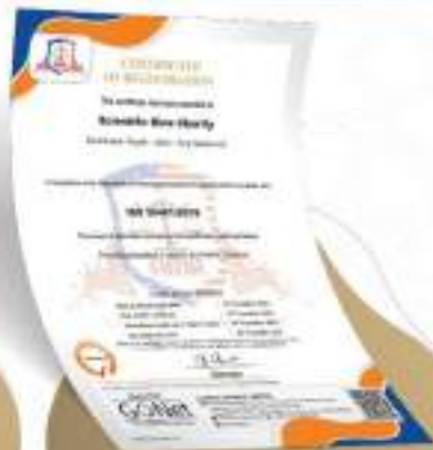
نظام إدارة المعرفة ISO 30401