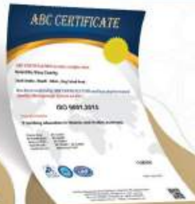
نظام إدارة الجودة ISO 9001/2015